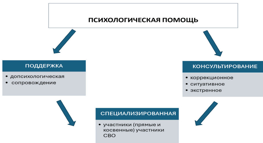
Рис. 5 / Fig. 5. Формы психологической помощи / Forms of psychological assistance

форма «помощи-поддержки» имеет процессуальный, достаточно продолжительный характер сопровождения личности в решении её индивидуальных проблем. В таком понимании психологическая помощь-консультирование и психологическая помощь-поддержка являются взаимодополняемыми, но не взаимозаменяемыми формами психологической практики. Допсихологическая помощь связана с феноменом помогающего поведения, которое определяется просоциальной позицией её субъекта и включает действия эмоционально-ценностного характера: поддержку, содействие, заботу, сочувствие, симпатию, сопереживание, эмпатию, сострадание и т. д., т. е. простые человеческие акты милосердия. Этот процесс сопровождается различными людьми, не имеющими отношения к обучению, – учёными и исследователями, профессионалами в различных областях науки и техники, тьюторами, консультантами, родителями и т. д. Третья форма – ответ на запрос, продиктованный жизнью семей и участников СВО. Это специализированная форма психологической помощи, включающая и консультирование, и поддержку – сопровождение семей участников СВО.