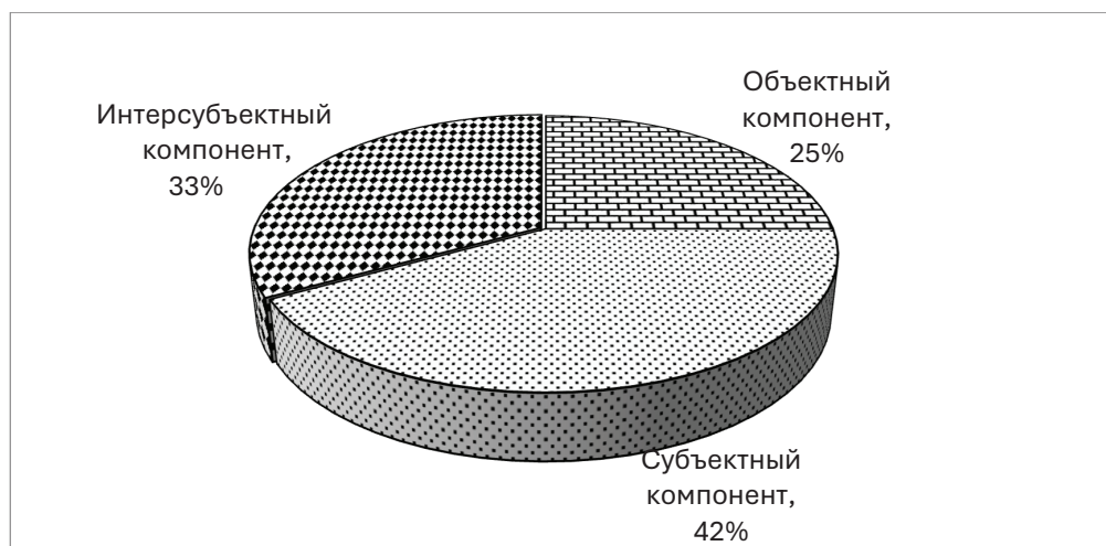
Рис. 4 / Fig. 4. Соотношение запросов по контекстам / The ratio of queries by context

Субъект в широком понимании определяется как источник активности, которая выступает мерой личных и социаль-