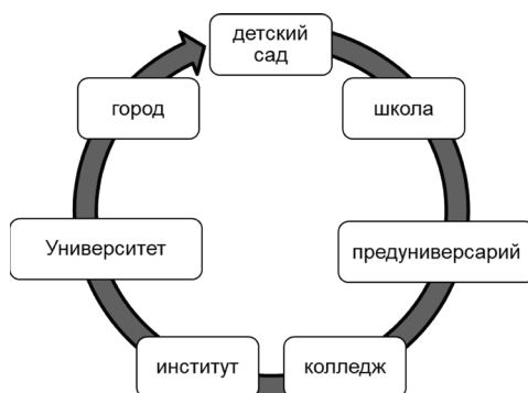
Рис. 2 / Fig. 2. Организационная структура экосистемы вуза / Organizational structure of the university ecosystem

индивидуализации, персонализации, профессионализации, в рамках которых последовательно на каждой ступени раз-