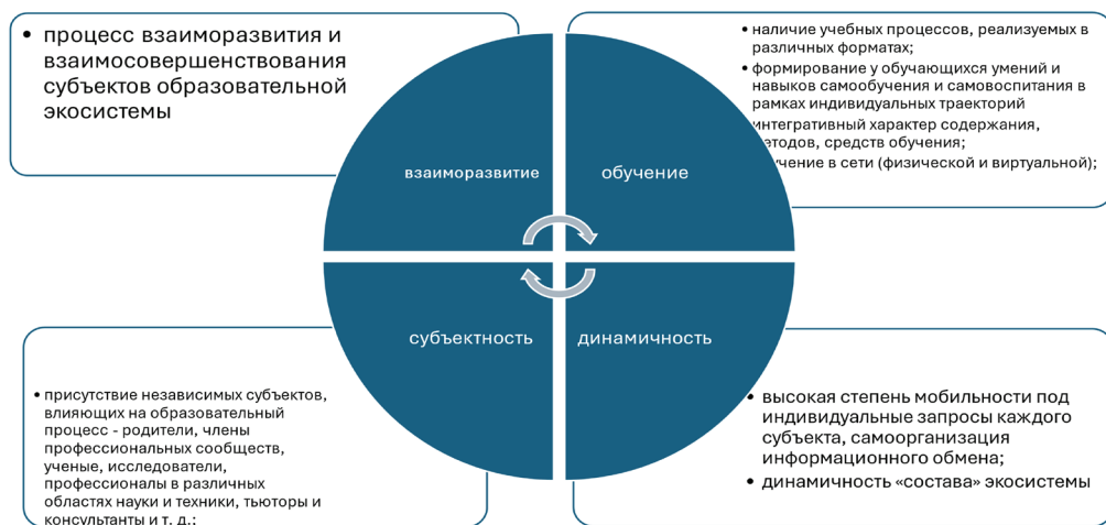
Рис. 1 / Fig. 1. Основные характеристики экосистемы вуза / The main characteristics of the university ecosystem

плекс очень разных составляющих, взаимодействие и взаимосогласованность которых образует единое образовательное пространство, интегрированное в региональный, городской экономический кластер и федеральную образовательную повестку [12]. Компонентами этой системы выступают субъекты образования, которые реализуют процессы обучения, воспитания, развития на всех возрастных